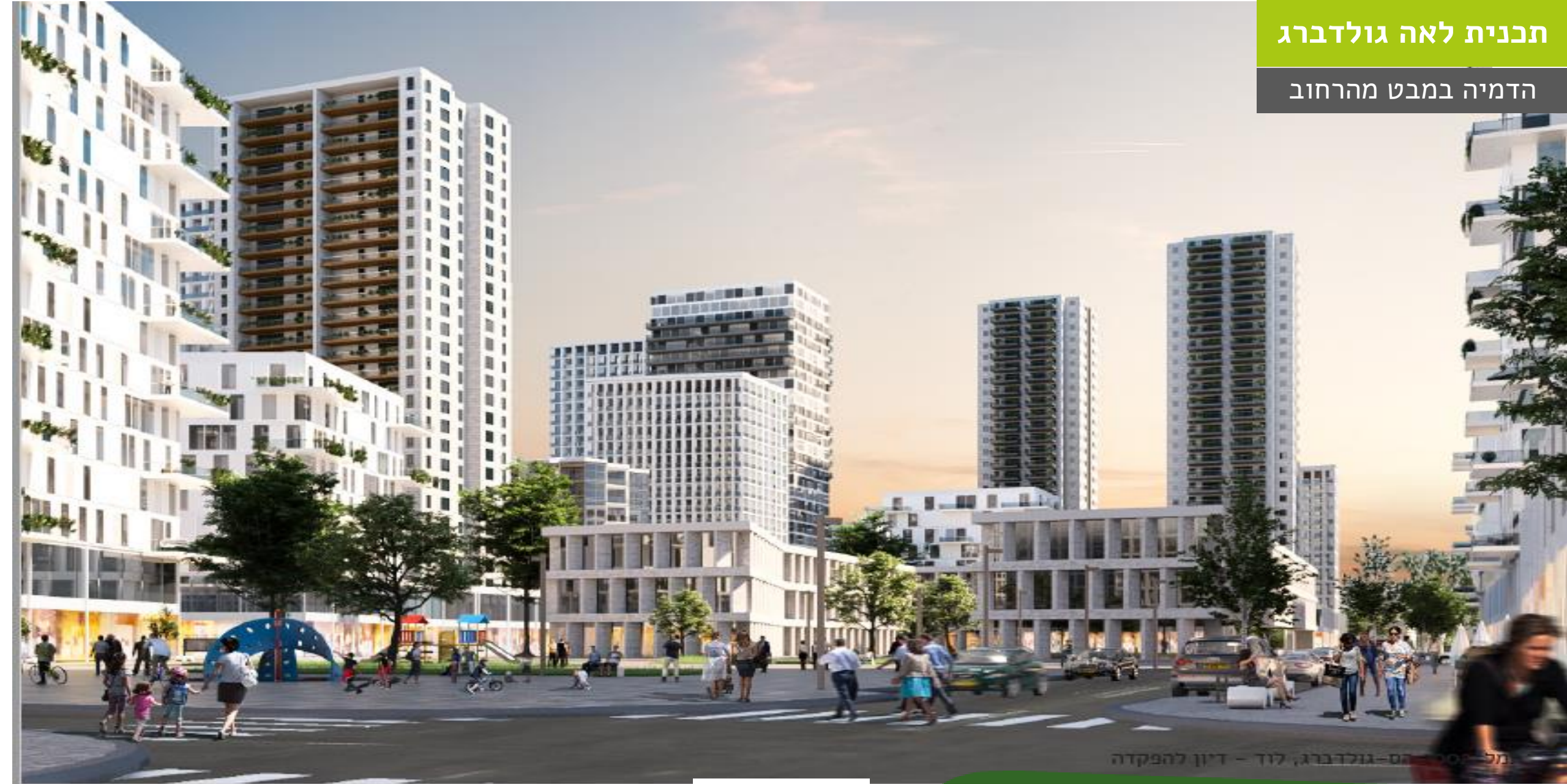
תוכנית גולדברג, לוד - דיון להפקדה